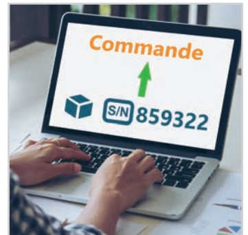
RÉSERVATION D' ARTICLES