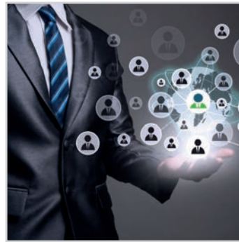
CRM, SUIVI DE LA RELATION CLIENT