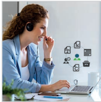
CENTRE D' ACTIONS ET D' APPELS