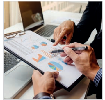
DÉCISIONNEL, STATISTIQUES PERSO.